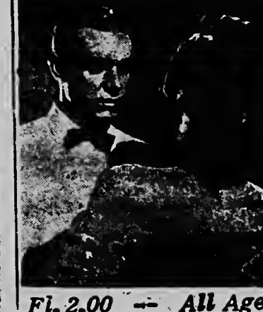
Fl. 2.00 -- All Ages

Awe nochi 18 nov. THUNDER BALL cu JAMES BOND